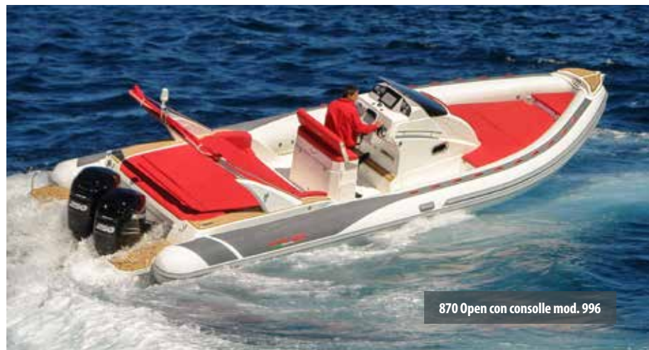
870 Open con consolle mod. 996